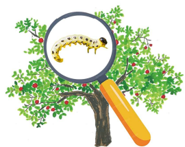
Repérer les arbres atteints par les chenilles

Conseils et astuces : Pour optimiser l'efficacité de votre traitement, il est recommandé d'ajouter un adhésif mouillant dans la bouillie de pulvérisation. Cela permet une meilleure adhérence du produit aux feuilles et limite le risque de lessivage en cas de pluie. Vous pouvez, par exemple, utiliser du savon noir ou de la lécithine de soja, deux solutions biologiques disponibles dans notre gamme Solu'Control.