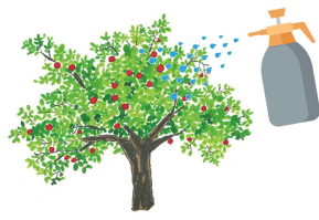
Traiter le feuillage face avant et face arrière