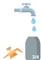
Remplir au 3/4 le pulvérisateur d'eau